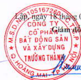
Đào Xuân Đức